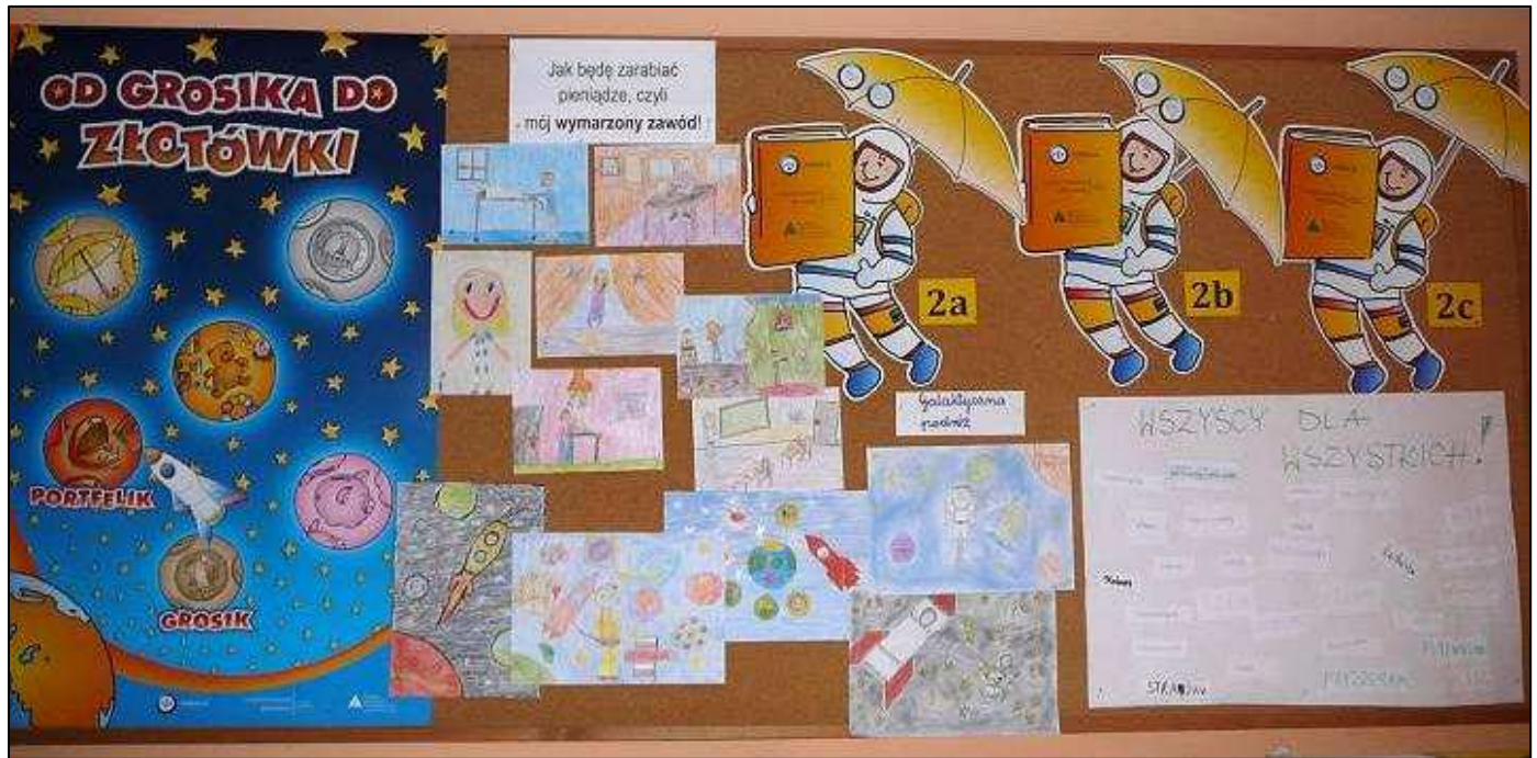
Tablica podsumowująca drugą podróż....