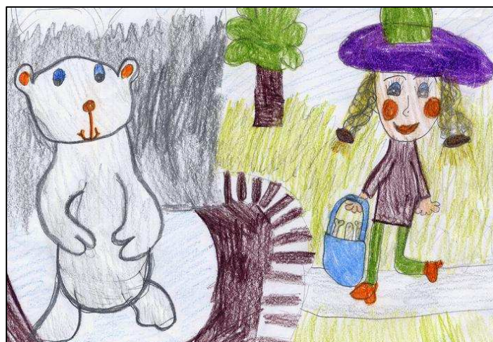
Będę pracowała w ZOO – Wiktoria Hamera