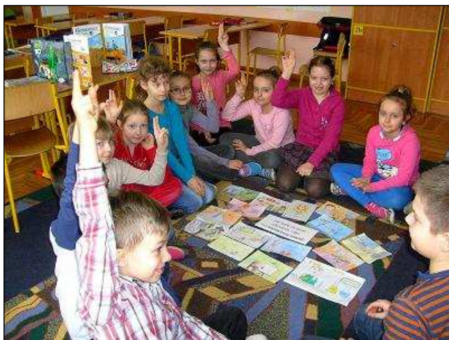
Dzieci rozmawiają na temat pracy.