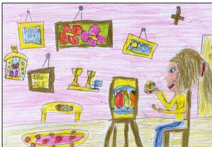
Będę malarką – Dominika Stanisławska

Oto wybrane prace uczniów klasy II b przedstawiające sposoby zarobkowania.