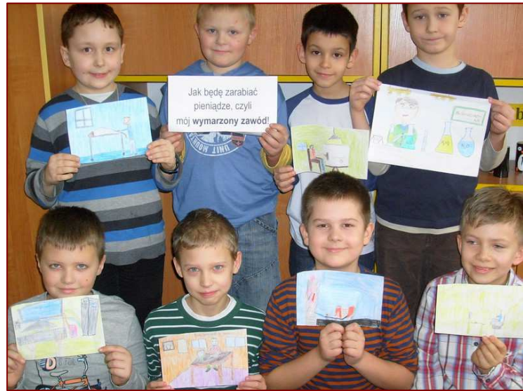
Jak będę zarabiać – propozycje dziewczynek i ...