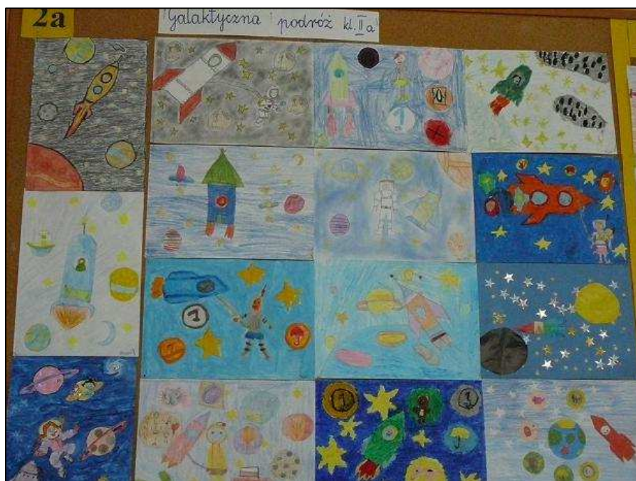
Prace klasy II a pt. „Galaktyczna podróż”