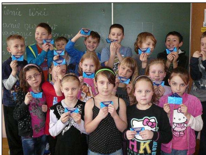
Uczniowie klasy II a z dumą prezentują własnoręcznie zrobione portfeliki.

Na planecie Portfelik dzieci uczyły się także gdzie przechowywać pieniądze i stwierdziły, że jednym ze sposobów na bezpieczne trzymanie pieniędzy jest PORTFELIK