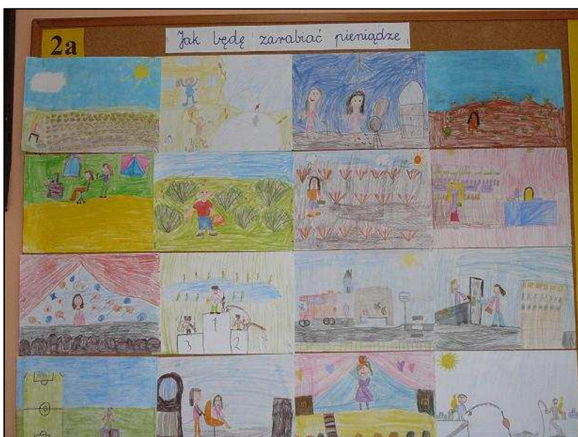
Propozycje zarobkowania podane przez uczniów klasy II a

Na planecie Portfelik dzieci uczyły się także gdzie przechowywać pieniądze i stwierdziły, że jednym ze sposobów na bezpieczne trzymanie pieniędzy jest PORTFELIK